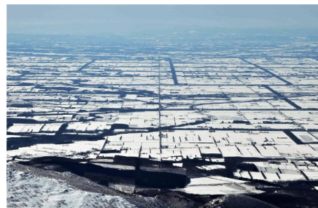
斜里平野の格子状区画

今回は斜里平野への移住と開拓の基盤となった区画について探ってみます。格子状の道路や防風林や畑の起源は、134年前の明治22年に実施された「殖民地選定調査」と、その後の「区画測設」にまで遡るのです。