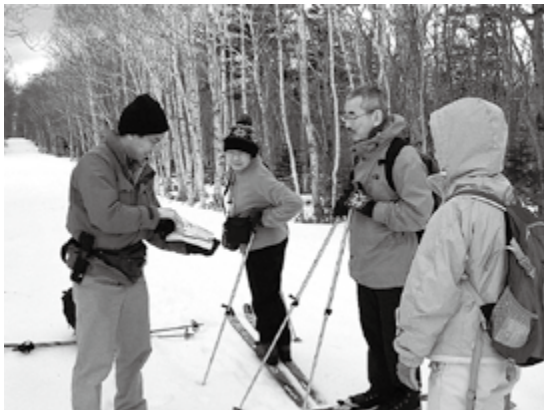
春の動物観察会(2011年4月23日)