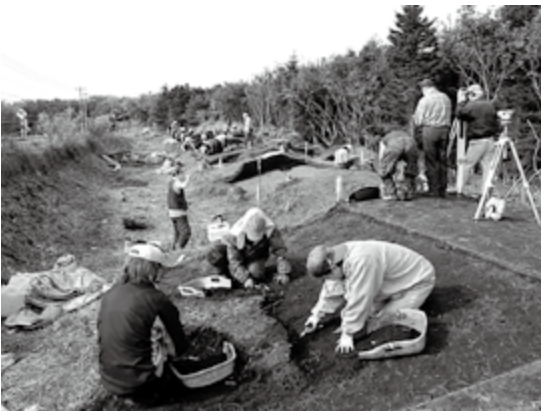
カモイベツ遺跡発掘風景(2011年10月14日)