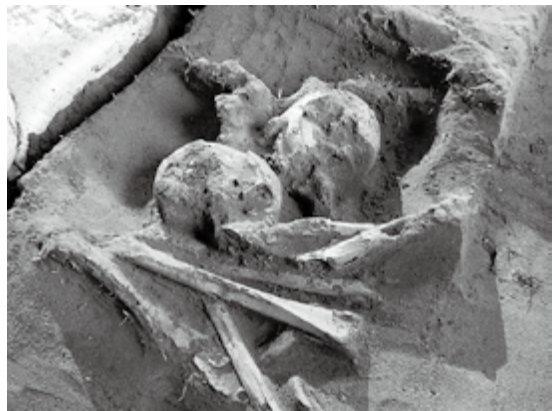
カモイベツ遺跡出土続縄文文化期人骨(2011年10月18日)