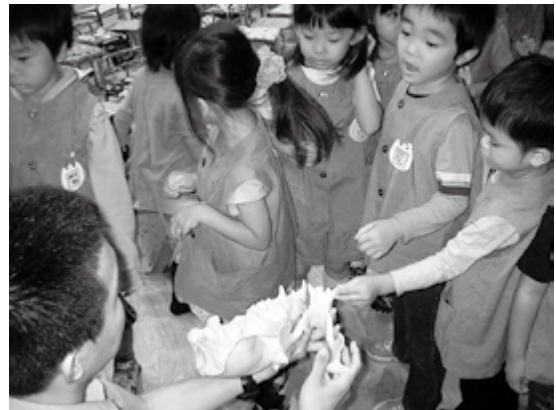
大谷幼稚園自然観察会(2011年9月14日)