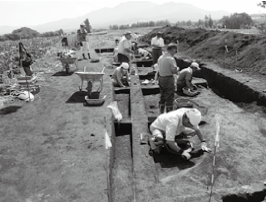
朱円2遺跡発掘風景(2011年7月26日)

峰浜市街地から約2km西の海岸砂丘上に位置し、続縄文時代前期の集石6基、石組炉1基、焼砂跡2基などや、続縄文時代後期の墓坑1基、集石1基、石組炉1基など合計27基が確認された。墓坑は再葬墓で、下部から副葬品としてガラスビーズ5点が出土した。遺物は9,712点が出土し、続縄文時代後期の後北C 2 -D式土器と続縄文時代前期の宇津内IIa式土器が主体であった。