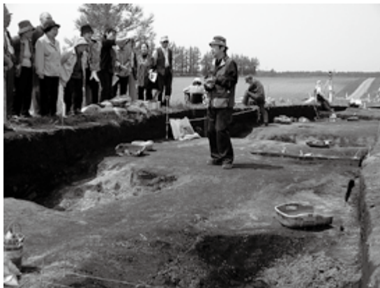
生きがい大学バスツアー（2011年5月26日）