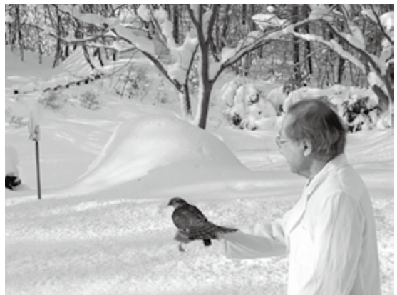
保護されたハイタカの放鳥（2012年1月12日）