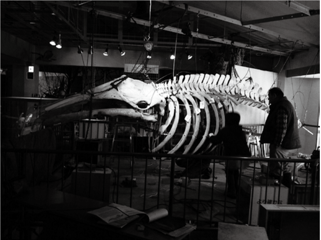
2011年12月21日、部分的な展示更新を実施するために休館中の常設展示室での作業風景。12月28日のプレオープン を1週間後にひかえ、組み上がりも間近のミンククジラ骨格。