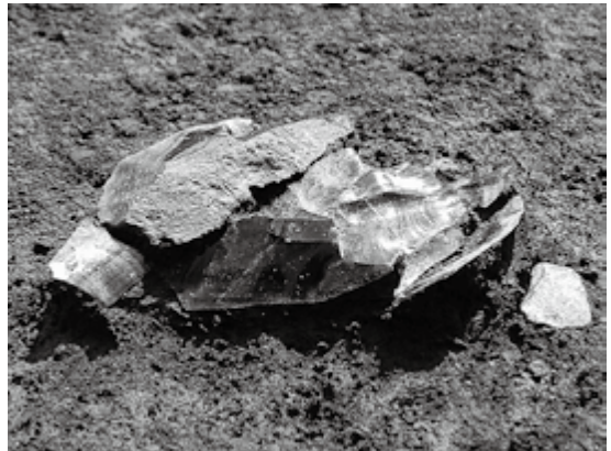
オクシベツ6遺跡剥片石器集中出土状況(2011年8月20日)