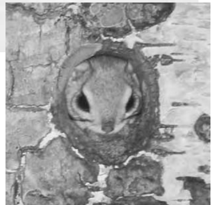
写真. エゾモモンガの営巣木(シラカンバ)上と巣穴から顔を出したエゾモモンガ. この営巣木は2002年秋に倒壊した。