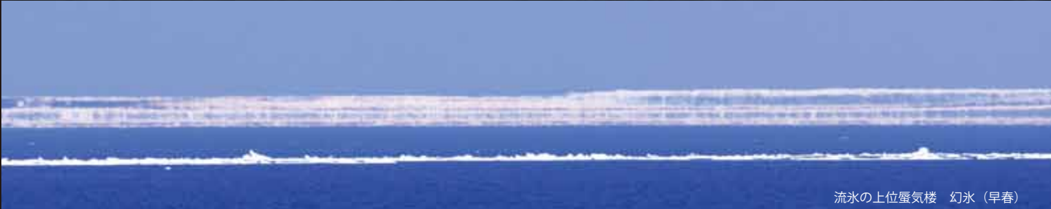
流氷の上位蜃気楼 幻氷（早春）