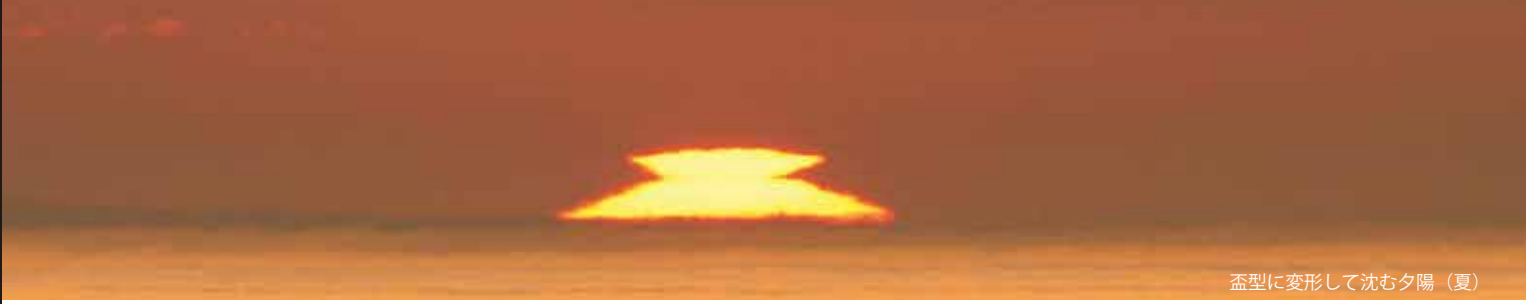
盃型に変形して沈む夕陽（夏）