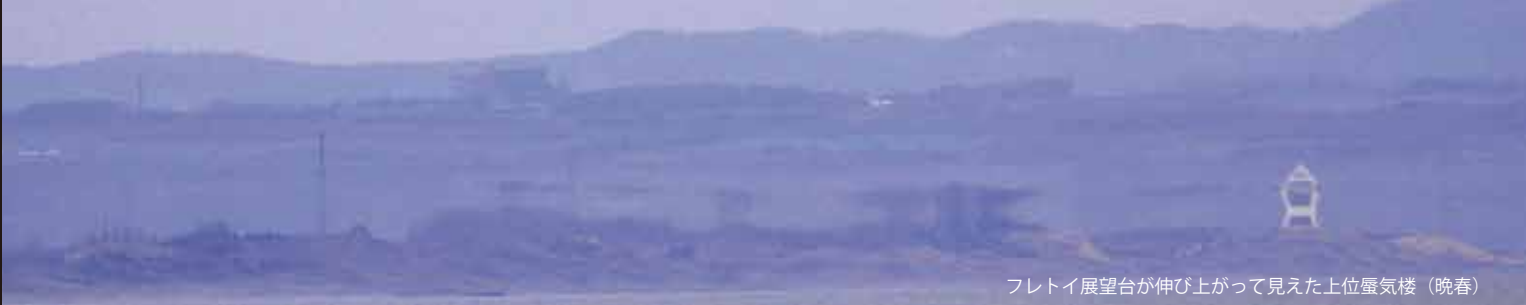
フレイト展望台が伸び上がって見えた上位蜃気楼（晩春）